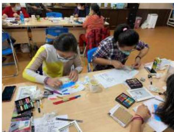
照片說明： 每位家長都專注在自己的作品上。