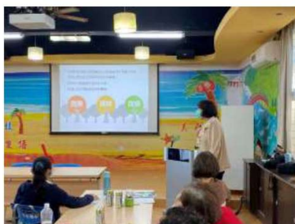
照片說明： 覺察→接納→改變，將美好的能量帶入心裡。