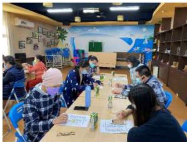
照片說明： 盤點每個人的壓力指數。