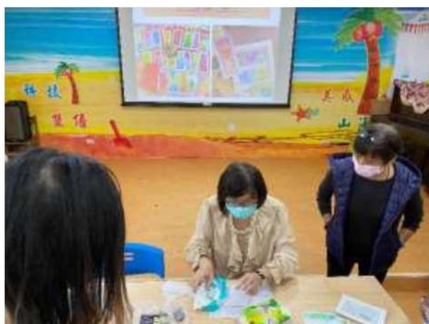
照片說明： 老師示範粉彩畫。