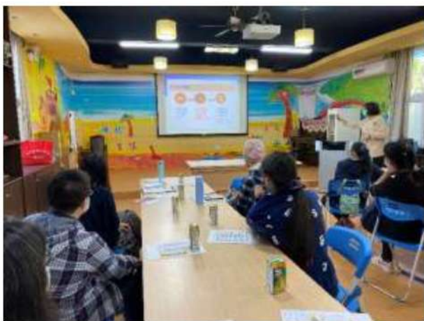
照片說明： 講師解說何謂「代間」。