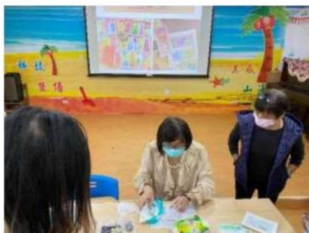
照片說明： 老師示範粉彩畫。