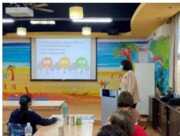
照片說明： 覺察→接納→改變，將美好的能量帶入心裡。