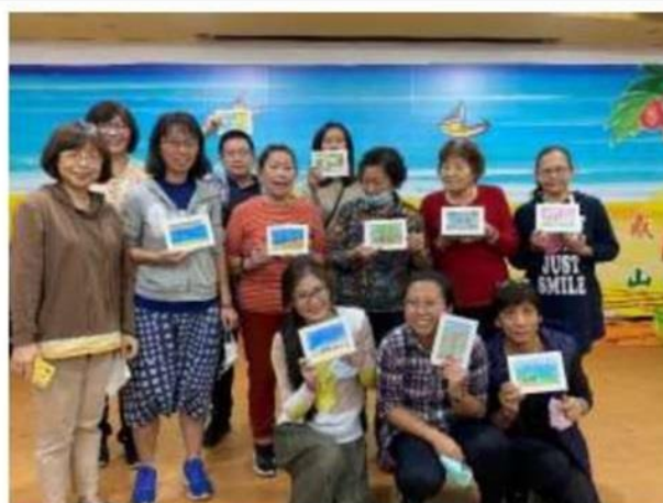
照片說明： 參與活動的每位學員，展示自己完成的作品。