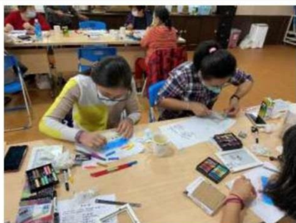
照片說明： 每位家長都專注在自己的作品上。