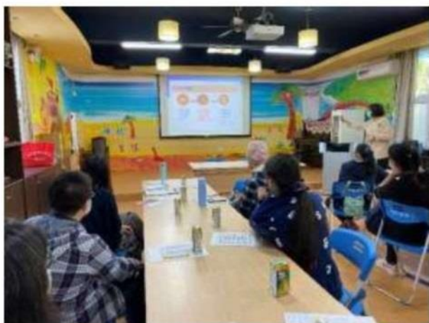
照片說明： 講師解說何謂「代間」。