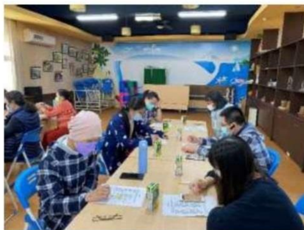
照片說明： 盤點每個人的壓力指數。