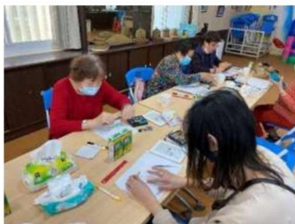
照片說明： 家長動手做做看。